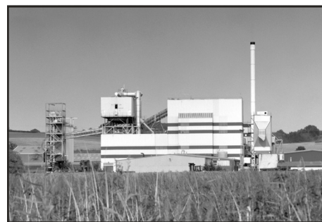
Anläggningen i Glanford, Grimsby

Fibrowatt, som ägde anläggningen när projektet startade, har nu gått samman med EPRL. Men våra kontaktpersoner är kvar och vi för just nu diskussioner om att installera Ecotube-systemet i två av deras övriga anläggningar i England.