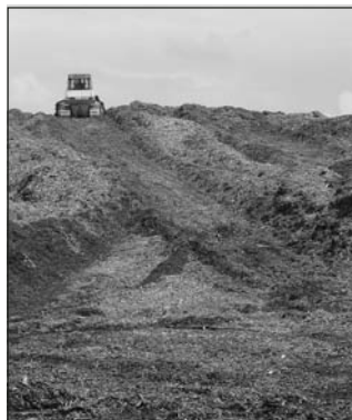
Imponerande bränslelager i Chateaugay

Chateaugay är ett litet samhälle med kanske 500 invånare i den allra nordligaste delen av staten New York nära gränsen till Canada. Direkt efter skylten "Chateaugay town" ser man 4-vägs korsningen och när det blivit grönt ljus är man strax ute ur samhället. Fullastade långtradare kommer från både USA och Canada med biobränsle till anläggningen. Bränslet