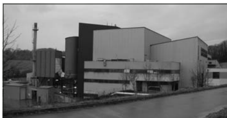
Lons-le-Saunier - traditionell design