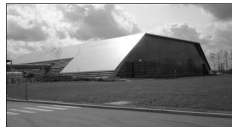
Bessieres - extravagant design

de två avfallseldade pannorna anlände planenligt till anläggningen på midsommarafton och projektet i övrigt är i fas med tidplanen. Vi berättade tidigare att pannorna ligger i en odlingsbygd strax utanför Toulouse i sydfrankrike och hit transporteras hushållsavfall samt mindre mängder industriavfall från Toulouse med omnejd. Den avfallseldade anläggningen byggdes 1998 och man inser snart att stadsarkitekterna i franska kommuner har en stark ställning i samhällshierarkin.